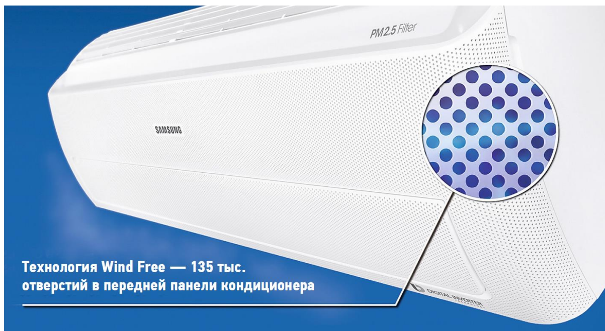
❖ Технология Wind Free обеспечивает максимальный комфорт для пользователя

Отличительная особенность новинки от Samsung в том, что охлаждённый воздух рассеивается через 135 тыс. микроотверстий, расположенных на всей площади лицевой панели внутреннего блока. Диаметр каждого отверстия составляет 0,005 мм, что в 20 раз тоньше человеческого волоса. Скорость воздушного потока в этом режиме составляет менее 0,15 м/с. Новая технология позволяет получить полное отсутствие прямого или отражённого холодного воздушного потока. Человек в помещении не испытывает никаких неприятных ощущений, только идеальный комфорт.