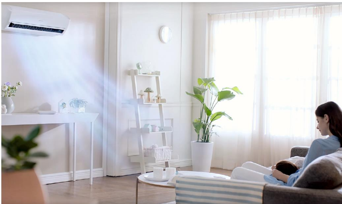
❖ Работа кондиционера Samsung серии AR9500M в нормальном режиме

Компания Samsung Electronics разработала и внедрила в производство новую модель кондиционера Samsung серии AR9500M с технологией Wind Free. В серии AR9500M представлены две инверторные модели холодопроизводительностью 2,5 и 3,5 кВт.